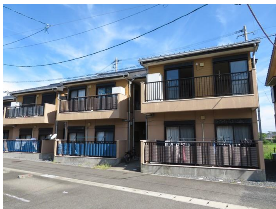
1F低層耐火構造+2F木造（バルコ側）