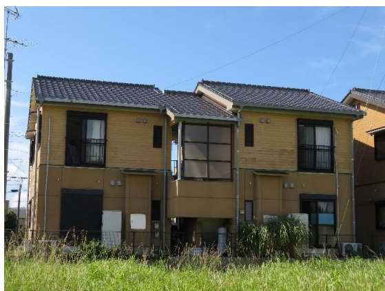
1F低層耐火構造+2F木造（階段側）